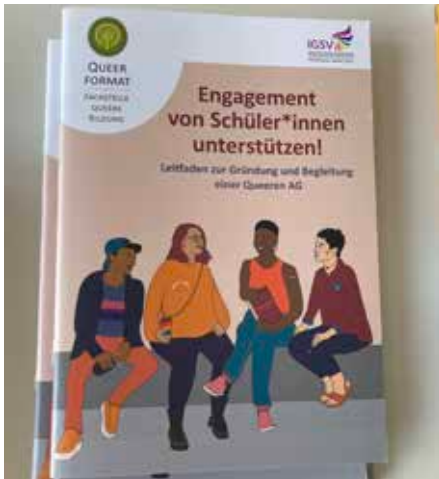
Hilfreiche Impulse für die Gründung der Diversitäts-AG.