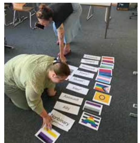
Teilnehmende lernen grundlegende Begriffe zum Thema LSBTIQ.

In diesem neu geschaffenen „Safe Space“ treffen sich queere Schülerinnen und Schüler für den Austausch in geschütztem Rahmen. Ergänzend dazu gibt es das niedrigschwellige Angebot einer queeren Chat-Gruppe. Die AG hat die Einrichtung einer „Toilette Für Alle“ initiiert und beteiligt sich aktiv an Planung und Durchführung von Projekten und Aktionstagen wie dem