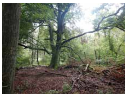
Rotbuche im Naturschutzgebiet in der Nähe von Kempen.

Naturdenkmale sind Einzelschöpfungen der Natur, wie beispielsweise Felsen, Höhlen, Quellen oder auch Bäume und Baumgruppen. Es können auch Flächen bis zu fünf Hektar sein, die einen besonderen Schutz benötigen – sei es aus wissenschaftlichen, naturgeschichtlichen oder landeskundlichen Gründen oder wegen ihrer Seltenheit, Eigenart oder Schönheit. Die Ausweisung von Naturdenkmalen