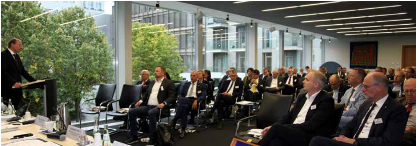
Der Präsident des LKT NRW, Landrat Dr. Olaf Gericke (Kreis Warendorf), spricht vor den Delegierten und Gästen während der Landkreisversammlung in Düsseldorf.

Bei der Landkreisversammlung des Landkreistags NRW am 1. Oktober 2024 in Düsseldorf sprach der nordrhein-westfälische Minister für Arbeit, Gesundheit und Soziales, Karl-Josef Laumann MdL, vor den Delegierten der 31 NRW-Kreise. Dabei stand die finanzielle Situation der Krankenhäuser in NRW und die Krankenhausreform im Fokus. Eingangsgang der Präsident des Landkreistags NRW, Landrat Dr. Olaf Gericke, Kreis Warendorf, auf das aktuelle politische Geschehen in den Kreisen und kommunalrelevante Landes- und Bundesthemen ein.