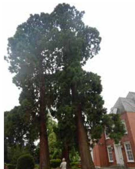
Mammutbäume in Schwalmtal.

Wie alle Bäume haben auch die Naturdenkmale unter den vergangenen Hitzesommern stark gelitten. Wochenlange Trockenperioden ohne Regen und eine zunehmende Anzahl heißer Tage haben die Vitalität vieler Bäume beeinträchtigt. Um diesem Problem entgegenzuwirken, wird eine ausreichende Wasserversorgung sichergestellt. Hier kommen oft sogenannte Baumtankstellen zum Einsatz, die beispielsweise vom Hausmeister vor Ort regelmäßig befüllt werden. An einigen Standorten wird zusätzlich ein spezielles Injektionsverfahren angewendet, um die Bodenqualität zu verbessern. Dabei werden verdichtete Bodenschichten mit Druckluft aufgelockert. In die entstandenen Hohlräume werden Mykorrhiza-Pilze, Wasserspeichergranulate und Huminsäuren eingebracht. So bekommen der Boden und die darin befindlichen Baumwurzeln mehr Sauerstoff und einen besseren Eintrag und Zugang zu Oberflächenwasser. Gleichzeitig wirkt sich das Verfahren positiv auf die Bodenlebewesen aus. Die Wasserversorgung in akuten Trockenperioden wird vom Kreis Viersen – soweit