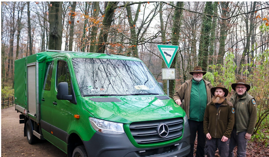
Drei Ranger sind im Kreis Steinfurt unterwegs. Eine Arbeitsgruppenleitung bei der unteren Naturschutzbehörde steuert die Einsätze.

bei Bedarf angepasst werden können. Für jede Gemeinde im Kreis gibt es außerdem einen oder mehrere Naturschutzbeauftragte. Diese leisten auf Augenhöhe zum Bürger einen wichtigen Beitrag zur Aufklärung und Abwendung von Schäden an Natur und Landschaft. Sie sind Bindeglied zur Behörde und ergänzendes Instrument zum amtlichen Naturschutz sowie zu den ehrenamtlichen Naturschutzverbänden. 2021 hat der Kreis die Rahmenbedingungen für die Ehrenamtlichen verbessert. Seitdem erhalten sie erhöhte Aufwandsentschädigungen und ein aufgestocktes Budget für „dienstlich“ begründete Bekleidungs- und Materialkosten. Der Kreis organisiert Fortbildungen sowie regelmäßige Veranstaltungen, bei denen die haupt- und ehrenamtlichen Akteure über aktuelle Belange informiert werden und sich über Erfahrungen und Kenntnisse austauschen können. Ein gut besuchtes und wertschätzend wahrgenommenes Angebot.