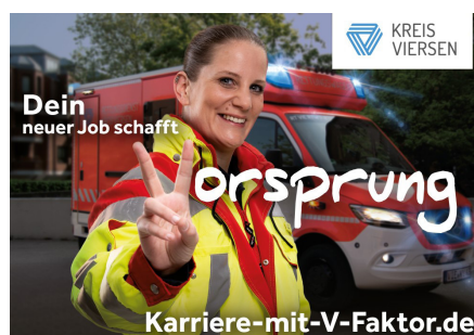
Karrieremotiv der Notfallsanitäterin.

Ein weiterer wichtiger Meilenstein zum Erfolg war die Entwicklung der eigenen Karriereseite www.karriere-mit-v-faktor.de , die speziell auf die Ansprache potenzieller Bewerberinnen und Bewerber zugeschnitten ist. Die Karriereseite funktioniert nicht nur als Informationsquelle, sondern auch als Visitenkarte der Arbeitgebermarke, denn sie spiegelt die Werte und Kultur des Kreises Viersen wider. Die authentischen Bilder, welche in Fotoshootings und Videoproduktionen mit