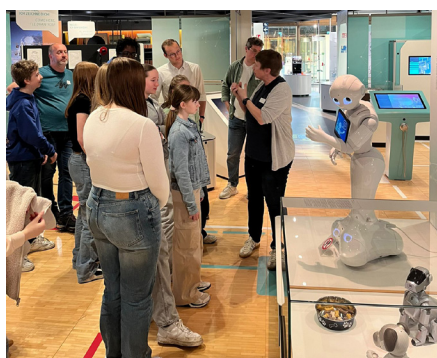
KJBK organisiert einen Ausstellungsbesuch für Jugendliche zum Thema Medien.

Die Jugendlichen haben folgende Meilensteine in den ersten Sitzungen gesetzt: Vernetzung der Jugendlichen in unterschiedlichen lokalen Formate mit dem Ziel „voneinander zu lernen“. Die Jugendlichen wünschen sich auf der Ebene Informationen zu den The-