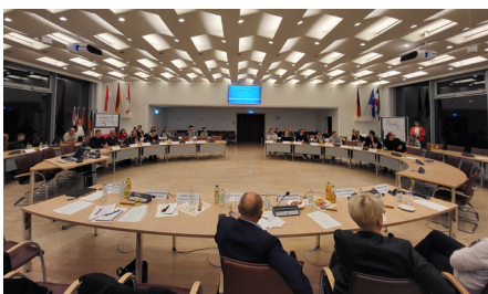
2.KJBK im großen Sitzungssaal des Kreishauses Paderborn.

Unter dem Titel „Kreisjugendbeteiligungskonferenz“ gab es im Jahr 2023 zwei Netzwerktreffen im Kreishaushaus Paderborn. Ca. 50 Jugendliche aus allen zehn Kommunen des Kreises Paderborn trafen sich mit Landrat und Mitarbeitenden des Jugendamtes, um ihre Themen auf Kreisebene zu diskutieren.